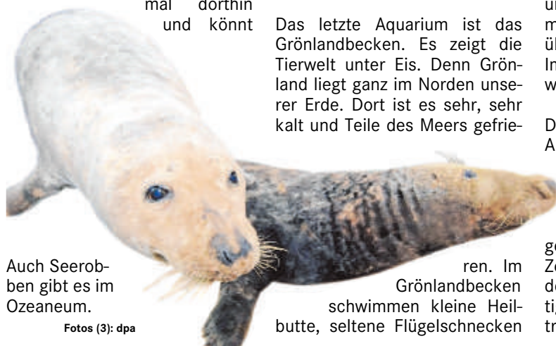
Auch Seerobben gibt es im Ozeaneum.

Die deutsche Bundeskanzlerin Angela Merkel hat das Museum am Freitag eröffnet. Sie wollte sehr gern bei der Eröffnung dabei sein. Deshalb wurde der Termin extra auf diesen Tag gelegt, weil die Kanzlerin nur da Zeit hatte. Nicht alle Stationen des Museums sind pünktlich fertig geworden, aber man kann es trotzdem schon besuchen.