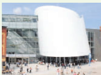
Das Ozeaneum von außen.