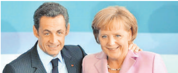
Frankreichs Präsident Nicolas Sarkozy begrüßte am Sonntag auch die deutsche Bundeskanzlerin Angela Merkel in Paris.

Und was haben die Politiker genau vor? Sie wollen, dass die Länder, die jetzt schon in der Europäischen Union (kurz: EU) sind, stärker mit den Ländern am Mittelmeer zusammenarbeiten. Die Länder in der EU arbeiten schon lange zusammen. Viele von ihnen haben zum Beispiel dasselbe Geld, den Euro. Nun sollen die Länder der EU auch stärker mit Ländern zusammenarbeiten, die auf der anderen Seite des Mittelmeers liegen. Das sind zum Beispiel Länder in Afrika und Asien, wie Marokko und Syrien. Außerdem soll die Union dafür sorgen, dass das Wasser im Mittelmeer wieder sauberer wird. Und es soll eine Mittelmeer-Universität geben.